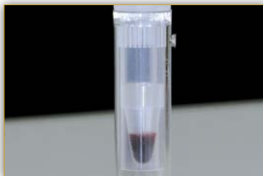
Специальные адаптеры для педиатрических образцов