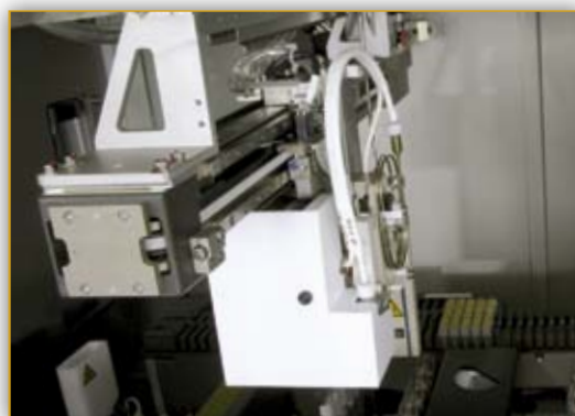
2 независимые дозирующие иглы, независимый транспортный модуль

Система ИН-1000 обладает высокой гибкостью и принципиально новой логикой автоматизации, ориентированной на скорейшее получение полного результата исследования по каждому образцу.