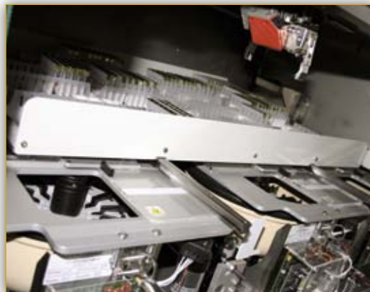
3 встроенные центрифуги

Элементы системы при необходимости компенсируют работу друг друга.