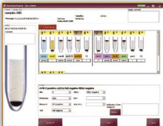
Несколько протоколов валидации результатов

Анализатор ИН-1000 позволяет проводить самый широкий спектр иммуногематологических исследований в гелевых картах «ID Micro Typing System», являющихся Золотым стандартом во всем мире – более 70 различных профилей, в том числе: