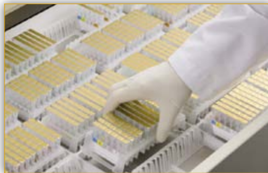
Зона хранения вместимостью до 240 ID-карт