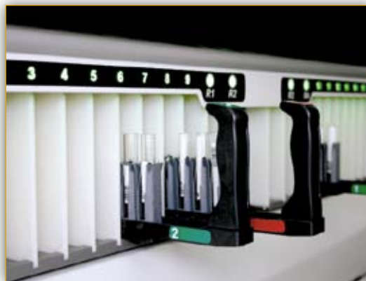
Возможность одновременной загрузки до 180 образцов и 28 реагентов