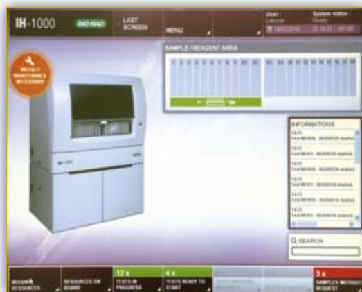
Интуитивно понятный сенсорный интерфейс